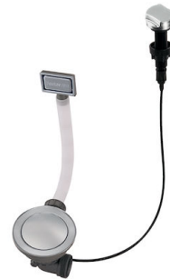
Automatischer Abfluss Space 8407 109