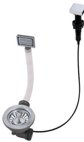
Automatischer Abfluss 8407 113