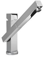
Mischbatterie Twix Plus 8427 020