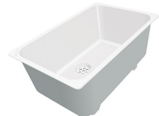
Weiße Wanne 8153 100