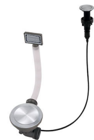
Automatischer Abfluss Space Push 8407 116